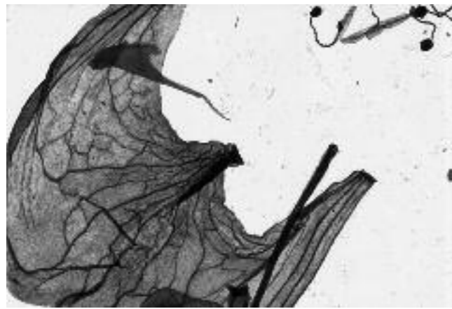
Abb. 6 Katrin Hotz, Diaprojektion aus der Reihe «Fragments d'un bouquet de fleurs», 2009