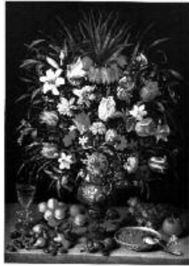
Abb. 2 Georg Flegel, Blumenstillleben, um 1600, Öl auf Leinwand, 86,5 x 62,5 cm, Washington, Mr. H. John Heinz III. Collection

in die zweite Hälfte des 16. Jahrhunderts bildeten diese Arrangements jedoch bloss die Staffage von meist religiösen Szenen. Die Gegenstände sollten die dargestellten Ereignisse als real erscheinen lassen. Oft weisen sie zusätzlich eine symbolische Komponente auf wie etwa die Vase mit der weissen Lilie, die auf Mariendarstellungen anzutreffen ist und für die Keuschheit der Maria steht. Autonome Stillleben, in denen Gegenstände und Pflanzen zum Inhalt von Gemälden werden, entstehen erst gegen Ende des 16. Jahrhunderts. Caravaggios Früchtekorb gilt als herausragendes Beispiel der damals neuen Bildgattung. Gleichzeitig ist es das einzige Stillleben Caravaggios, das sich über all die Jahrhunderte erhalten hat. Jedoch kann man davon ausgehen, dass Caravaggio noch weitere Bilder dieser Art erstellt hat, und dass er eine wesentliche Rolle bei der Etablierung dieser Bildgattung in Italien spielte.