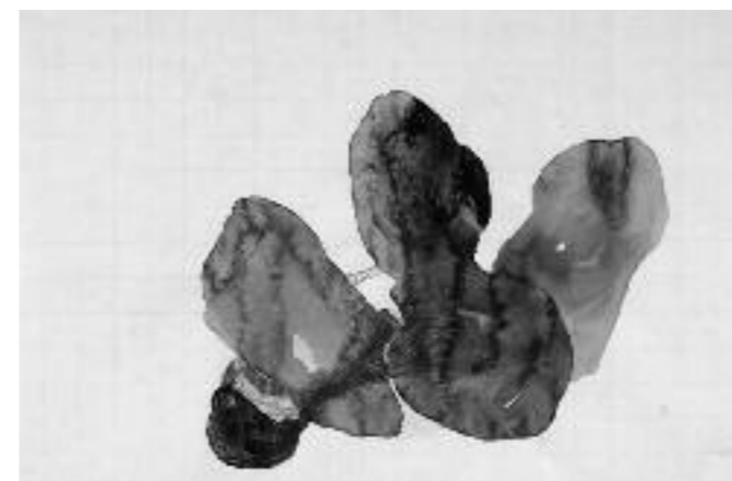
Abb. 8 Katrin Hotz, Blatt aus der Reihe «Im Gehirn ist harzig die Erinnerung», 2009 bouquet de fleurs», 2009

Wie die Fotografien Karl Blossfeldts zeigen auch die Diabilder von Katrin Hotz den Formenschatz der Pflanzen mit ernüchternder Deutlichkeit. In einem wesentlichen Punkt unterscheiden sich die Werke aber. Während Blossfeldt die Pflanze den Betrachtenden als Monument präsentiert, erscheint die Pflanze bei Hotz als etwas äusserst Fragiles. Möglicherweise wird der Eindruck durch den Bearbeitungsprozess der