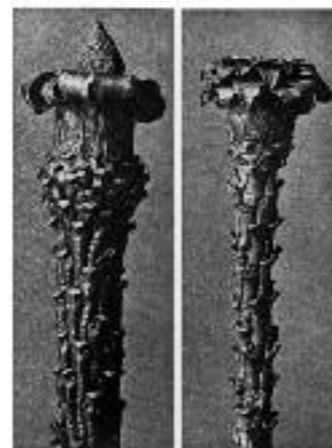
Abb. 5 Karl Blossfeldt, Picea abies . Fichte, Rottanne. Zweigspitzen ohne Nadeln in 10-facher Vergrößerung, vor 1926, aus Reihe «Urformen der Kunst» (Aus: Blossfeldt 1994, Tafel 21)