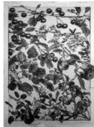
Abb. 4 Tafel 130 aus dem Musterbuch «Die Pflanze in Kunst und Gewerbe» (Aus: Gerlach 1886)