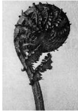
Abb. 3 Karl Blossfeldt, Matteucia struthiopteris . Deutscher Straussfarn. Junger eingerollter Wedel in 8-facher Vergrößerung, vor 1926, aus der Reihe «Urformen der Kunst» (Aus: Blossfeldt 1994, Tafel 46)

während seiner Ausbildungszeit in Mailand in einem intellektuell sehr fruchtbaren Umfeld bewegte, dürfte sie gekannt haben. Es ist möglich, dass sein Fruchtkorb – auf dem verhältnismässig viele Trauben abgebildet sind – als gezielte Anspielung auf die Anekdote von Plinius gedacht war. Caravaggio ist mit seinem Fruchtkorb dem von Plinius geäusserten Ideal doch sehr nahe gekommen. Noch beachtlicher wird Caravaggios Leistung, wenn man davon ausgeht, dass er sein Stillleben tatsächlich direkt nach der Natur, also nach den vor ihm liegenden Früchten, gemalt hat, und dass der künstlerische Akt ein Wettlauf mit der Zeit, bzw. gegen den Verfallsprozess der Früchte darstellen musste.